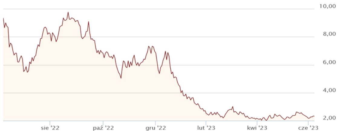
Rys. 2 Wykres przedstawiający zmiany cen gazu ziemnego w okresie 06.2022 – 06.2023 (USD/mln btu) 10

Ceny uprawnień do emisji CO 2 również ustabilizowały się na poziomie poniżej 100 EUR/t. Na dzień 12 lipca 2023 r. notowania uprawnień do emisji CO 2 oscylują na poziomie około 86 EUR/t (Rys. 3).