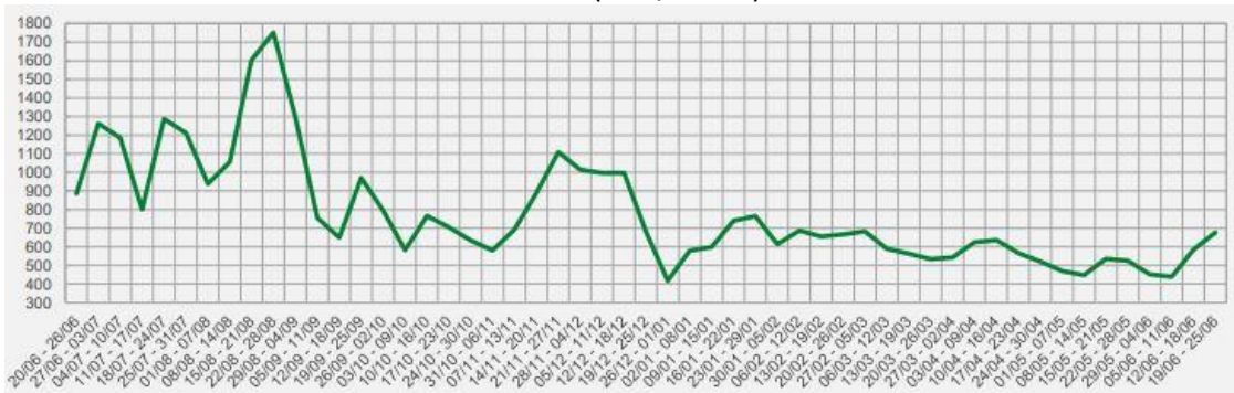
Rys. 4 Wykres przedstawiający średnioważone ceny tygodniowe w okresie 06.2022 – 06.2023 (PLN/MWh) 12

Stabilizację cen energii elektrycznej dobrze obrazują także dane TGE przedstawiające średnie ceny transakcji RDN w danych miesiącach. Średnia miesięczna cena transakcji RDN osiągnęła szczyt w sierpniu 2022 roku, a od września 2022 roku znajduje się w trendzie spadkowym. Warto zauważyć, że od marca 2023 roku średnia miesięczna cena transakcji RDN jest niższa niż ustalone Ustawą interwencyjną ceny maksymalne dla części odbiorców końcowych – gospodarstw domowych (693 zł/MWh) oraz odbiorców wrażliwych, w tym sektora mikro-małych i średnich przedsiębiorstw oraz jednostek samorządu terytorialnego (785 zł/MWh) co zaprezentowano na Rys. 5.