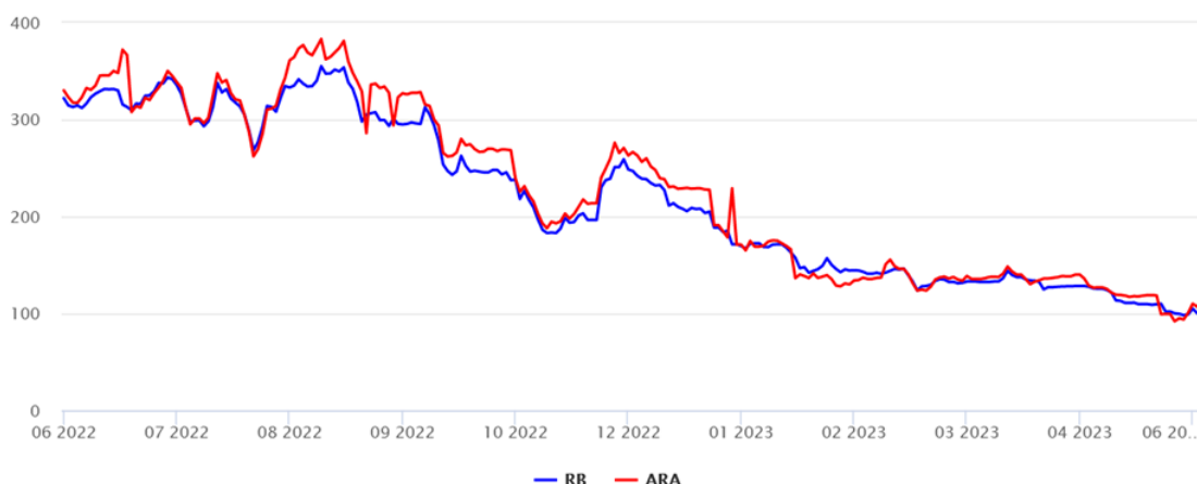
Rys. 1 Wykres przedstawiający zmiany cen węgla w okresie 06.2022 – 06.2023 (USD/t) 9

Ceny węgla oraz gazu ziemnego stopniowo spadają od końca 2022 r. Ceny węgla na koniec czerwca 2023 r. oscylują w granicach 100 USD/t (Rys. 1), a ceny gazu ziemnego oscylują na poziomie około 2,2 USD/mln btu (Rys. 2).