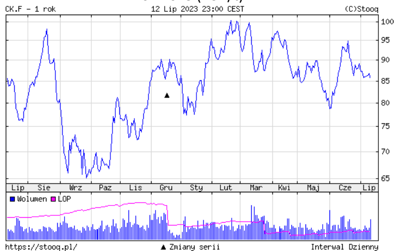
Rys. 3 Wykres przedstawiający zmiany cen uprawnień do emisji CO 2 w okresie 07.2022 – 07.2023 (EUR/t) 11

Również ceny energii elektrycznej w ramach RDN w Polsce stabilizują się - co potwierdzają dane zaprezentowane w najnowszym raporcie Towarowej Giełdy Energii podsumowującej transakcje za czerwiec 2023 roku.